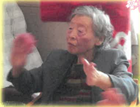
思わず一緒に踊りだしました