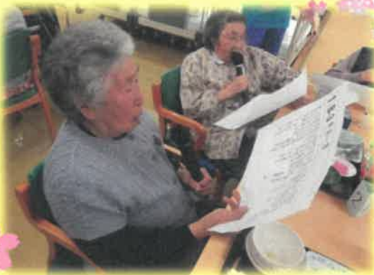
楽しく皆で歌っています♪