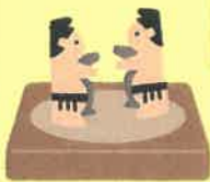
丁寧に花ちり紙をたたんで… いざ勝負！